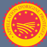
LES PRODUITS SOUS APPELLATION D'ORIGINE (AOC OU AOP)