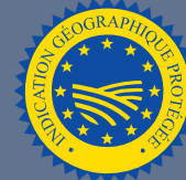
LES PRODUITS BÉNÉFICIAINT D'UNE INDICATION GÉOGRAPHIQUE (IGP)